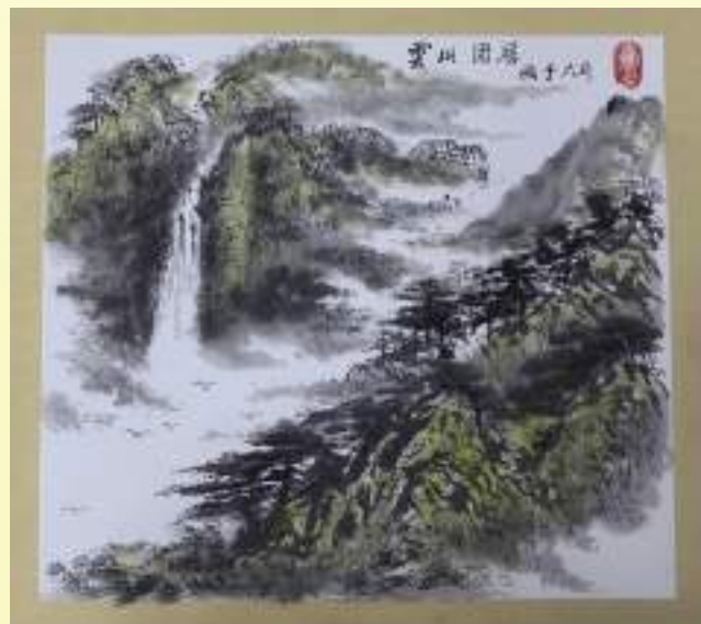
孔宪玉《云山固居》绘画类第三名